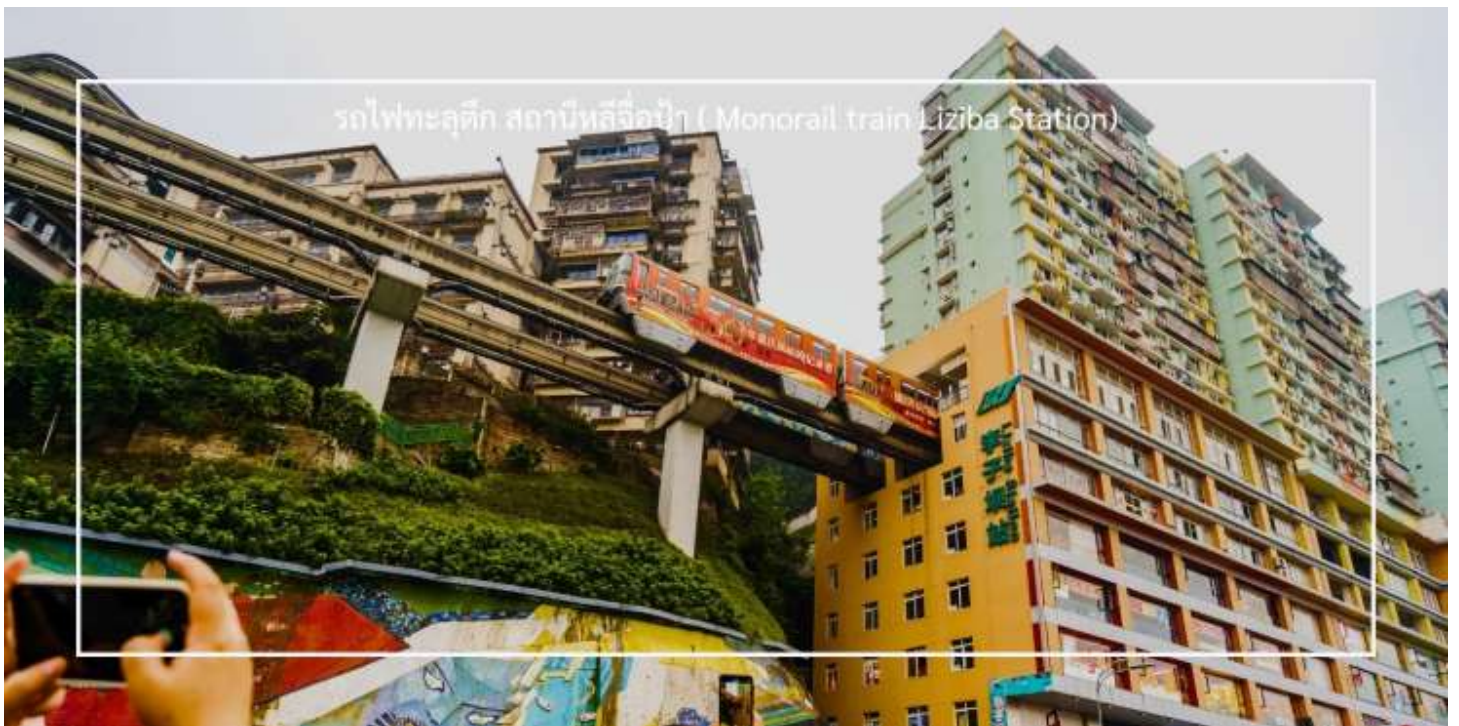
รถไฟทะลุตึก สถานีหลี่จื่อป้า ( Monorail train Liziba Station)

นำท่าน นั่งรถไฟทะลุตึก (Monorail train Liziba Station) เป็นหนึ่งในประสบการณ์ที่น่าสนใจและเป็นเอกลักษณ์ในเมืองฉงชิ่ง รถไฟเส้นนี้มีเส้นทางที่ผ่านอาคารและที่อยู่อาศัย ทำให้ผู้โดยสารรู้สึกเหมือนกำลังนั่งรถไฟที่ทะลุผ่านตึกสูง เส้นทางที่น่าสนใจในรถไฟนี้รวมถึงสถานีที่มีชื่อเสียง เช่น สถานีหลี่จื่อป้า (Liziba Station) ซึ่งตั้งอยู่ในพื้นที่ที่มีความหนาแน่นของประชากร การนั่งรถไฟทะลุตึกนี้เป็นวิธีที่ยอดเยี่ยมในการสัมผัสกับวัฒนธรรมเมืองฉงชิ่งและชื่นชมกับการพัฒนาเมืองที่น่าทึ่ง หากคุณมีโอกาสไปเยือนฉงชิ่ง อย่าลืมลองนั่งรถไฟเส้นนี้เพื่อสัมผัสประสบการณ์ที่ไม่เหมือนใคร