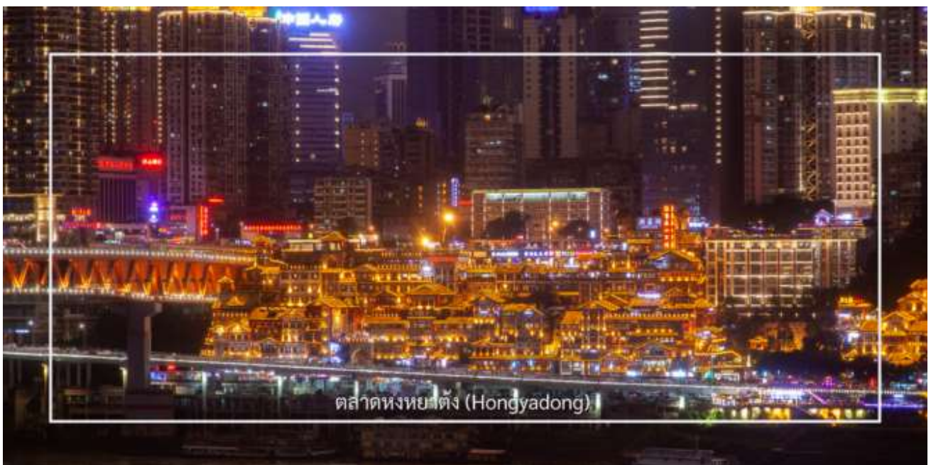
ตลาดหงหยาดัง (Hongyadong)

จากนั้นเดินทางไปยัง ตลาดหงหยาดัง (Hongyadong) หรือที่เรียกว่า "Hongya Cave" เป็นสถานที่ท่องเที่ยวที่มีชื่อเสียง ในเมืองฉงชิ่ง โดยตั้งอยู่ริมแม่น้ำแยงซี มีบรรยากาศที่เต็มไปด้วยวัฒนธรรมและประวัติศาสตร์ ตลาดหงหยาดังเป็นพื้นที่ที่มี อาคารแบบดั้งเดิมที่สร้างขึ้นในสไตล์สถาปัตยกรรมแบบชิโน-ทิเบต โดยมีร้านค้า ร้านอาหาร และบาร์จำนวนมาก ที่นี่คุณ สามารถลิ้มลองอาหารท้องถิ่นที่อร่อย เช่น ฮอทพอทฉงชิ่ง (Chongqing Hot Pot) และขนมพื้นเมืองอื่นๆ นอกจากนี้ ตลาด หงหยาดังยังมีวิวทิวทัศน์ที่สวยงาม โดยเฉพาะในช่วงเย็นเมื่อไฟประดับส่องสว่าง ที่ทำให้บรรยากาศมีความโรแมนติกและน่า ตื่นเต้น คุณสามารถเดินเล่นตามทางเดินที่มีการจัดแสดงงานศิลปะและสินค้าท้องถิ่น