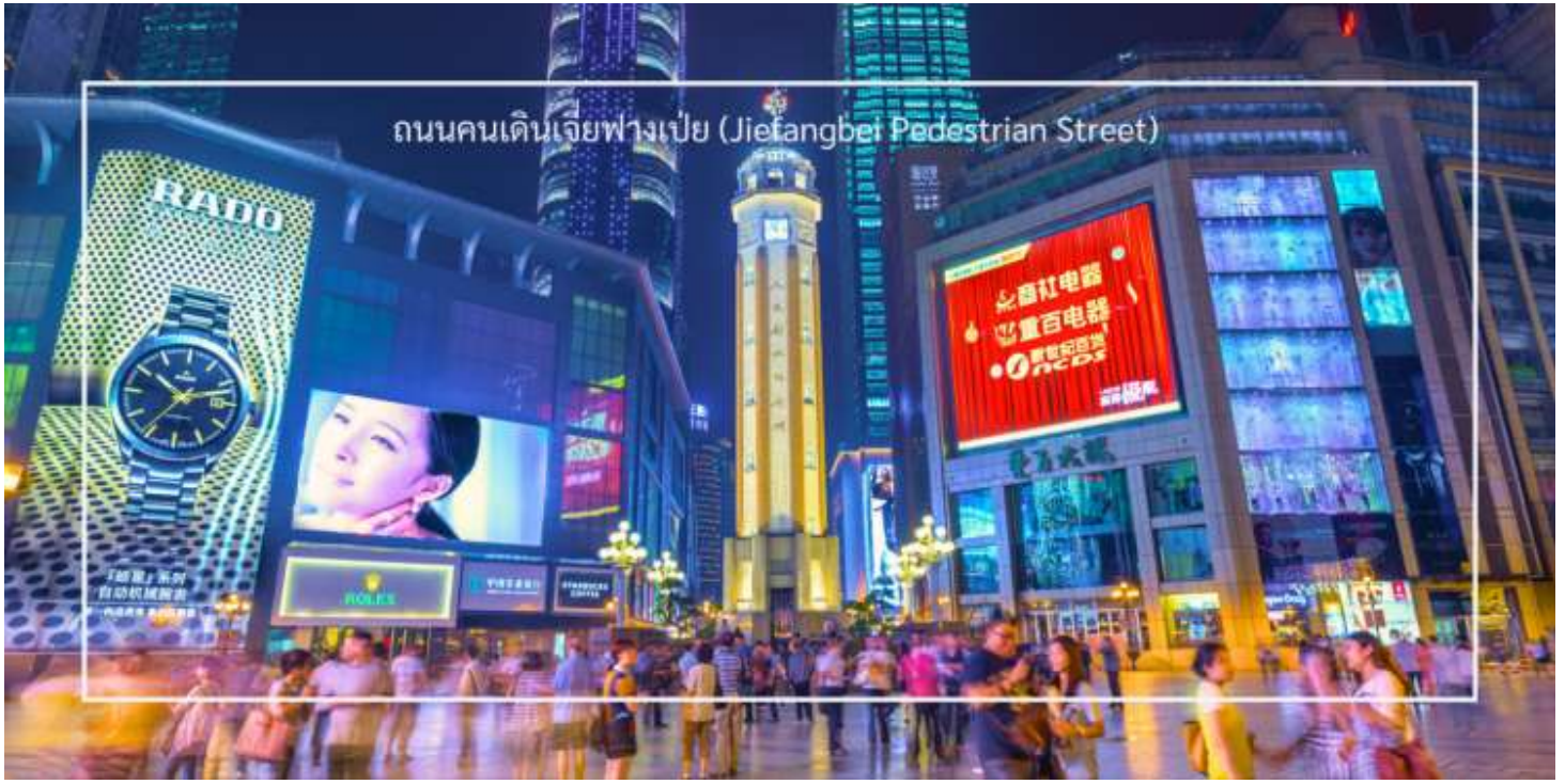
ถนนคนเดินเจียงเป่ย์ (Jiefangbei Pedestrian Street)