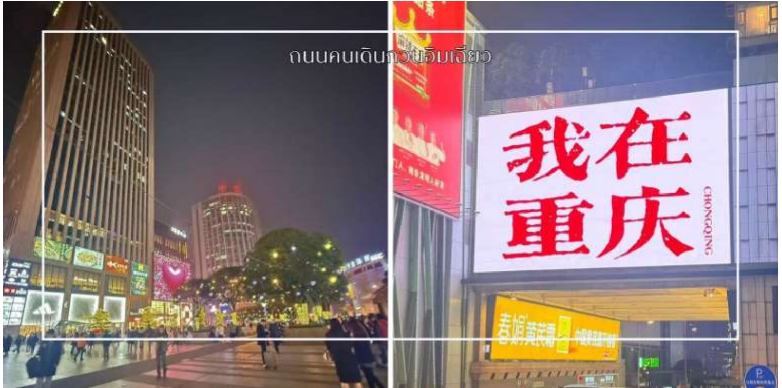
ถนนคนเดินถว้บรัมเจียว

ซึ่งอย่างแท้จริง อีกหนึ่งไฮไลท์สำคัญคือจุดถ่ายภาพยอดนิยม บ้ายไฟ 我在重庆 (I am in Chongqing) ซึ่งถือเป็นแลนด์มาร์ก เช็คอินที่นักท่องเที่ยวไม่ควรพลาด