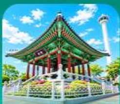
สวนเขาดูซาน