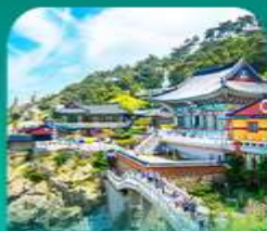
วัดแฮดงกุงกุงซา

เที่ยวปูซานแบบแกรนด์ แกรนด์ ทั้งสายอาร์ท สายบู และสายช้อปปิ้ง • เขิกจันบนท่าฮอปส์สุดคูลเลอร์ฟูล ที่ท่าเรือจินนิบ (BUSAN BUNEZIA) เติบสันหมู่บ้านคิมชอน ซาซโดริมห้างปูซานสุดน่ารัก พลาดไม่ได้กับการนั่งรถไฟปูกัน ขบวนทะเลเมืองปูซาน • เสริมสิริมงคลที่วัดแฮดงกุงซา วัดริมทะเลชื่อดัง พร้อมช้อปปิ้งที่ลือเลื่องพรีเมียมเจ้าก๊อ และตลาดบันโพดง ก่อนปิดท้ายด้วย ย่านวีฮันสุดชิค ซอ มอน ออเนิว พร้อมชมบวงสะพาน ควังอินยามค่าขึ้นสุดโรแมนติก