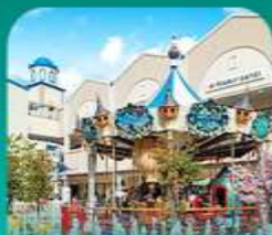
ลือเลื่อง เจ้าก๊อ