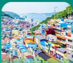
หมู่บ้านคิมชอน