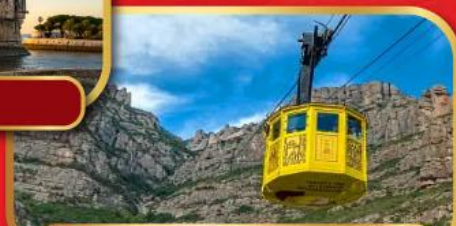
ขึ้นกระเช้าอารามมอนต์เซอรัลด์