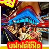
บุฟเฟ่ต์ซีฟู้ด