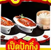
เปิดปิ้งกั๊ง