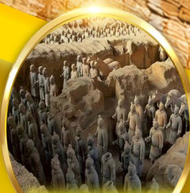
สุสานทหาร ดินเผาจีนซี