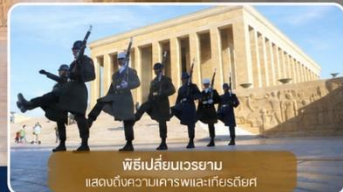
พิธีเปลี่ยนเวรยาม แสดงถึงความเคารพและเกียรติยศ