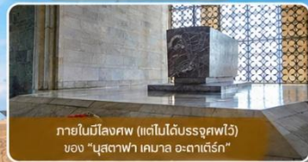
ภายในโถงศพ (แต่ไม่ได้รับอนุญาต) ของ "มุสตาฟา เคมาล อะตาเติร์ก"