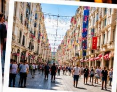
ISTIKLAL STREET (Grand Avenue of Pera) ถนนสายช้อปปิ้ง อิม บิล ครบจบในที่เดียว