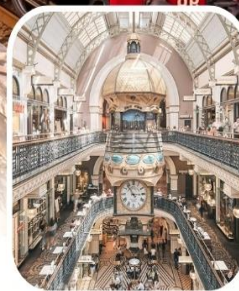
QUEEN VICTORIA BUILDING