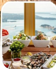
SKYFEAST BUFFET SYDNEY TOWER