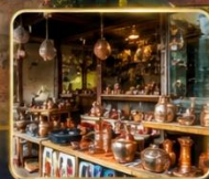
เลือกซื้อของฝากงานหัตถกรรมพื้นเมือง

สัมผัสเสน่ห์แห่งอดีตในเมืองที่เวลาเดินช้าลง กับสถาปัตยกรรมอันงดงาม วัฒนธรรมที่ยังคงมีชีวิต และความอบอุ่นจากผู้คน