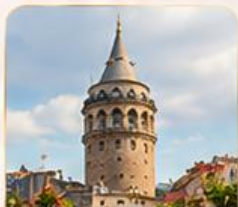
GALATA TOWER หอคอยกาลาตา