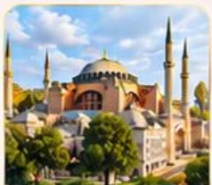
HAGIA SOPHIA โบสถ์เซนต์โซเฟีย