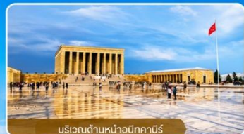
บริเวณด้านหน้าอนีกาบิร์

สถานที่สำคัญที่คนตุรกีให้ความเคารพและจดจำผู้นำผู้ยิ่งใหญ่ ที่อุทิศทั้งชีวิตเพื่อชาติ ศาสนา และประชาชน