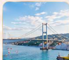
BOSPHORUS STRAIT ช่องแคบบอสฟอรัส