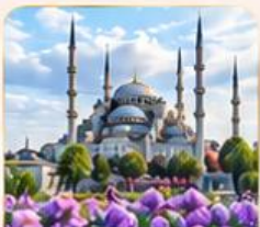
BLUE MOSQUE สุเหร่าสีน้ำเงิน