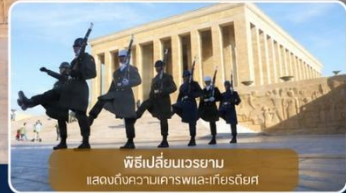
พิธีเปลี่ยนเวรยามแสดงต้นตอความเคารพแก่เกียรติยศ

ได้เวลาเดินทางทางสู่เมือง "ซาฟรานโบลู" (Safranbolu) คือเมืองท่องเที่ยวที่มีชื่อเสียงของจังหวัดการาบึค (Karabük) ในภูมิภาคทะเลดำตุรกี เป็นเมืองที่มีความสำคัญทางด้านประวัติศาสตร์ของประเทศ ตุรกี โดยเฉพาะชื่อเสียงเกี่ยวกับสถาปัตยกรรมซาฟรานโบลู ที่มีอิทธิพลต่อพัฒนาการชุมชนเมืองทั่วทั้งจักรวรรดิออตโตมัน ต่อมาในปี 1994 เมืองซาฟรานโบลู ได้ถูกองค์การยูเนสโกยกให้เป็นมรดกโลกทางด้านวัฒนธรรม