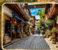
เดินเล่นย่านเมืองเก่าบรรยากาศย้อนยุค