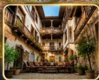
บ้านเรือนสไตล์ออตโตมันอายุกว่า 200 ปี

เมืองท่องเที่ยวที่มีชื่อเสียงของจังหวัดการาบึค (Karabük) ในปี 1994 เมืองซาฟรานโบลู ได้ถูกองค์การยูเนสโกยกให้เป็น มรดกโลกทางด้านวัฒนธรรม