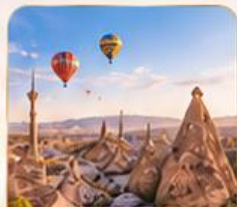
CAPPADOCIA คัปปาโดเกีย