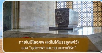
ภายในมิโอสคฟ (แต่ไปไม่ถึงจุดฟรี) ของ "มุสตาฟา เคมาล อะตาเติร์ก"