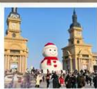
ตึกตาคิยะ-ยักซ์