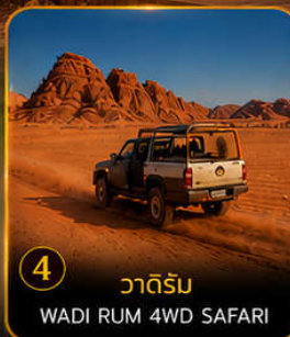
4 วาดีรัม WADI RUM 4WD SAFARI