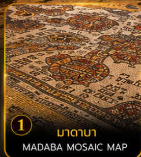
1 มาดaba MADABA MOSAIC MAP