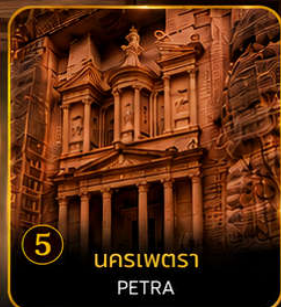
5 นครเพตรา PETRA