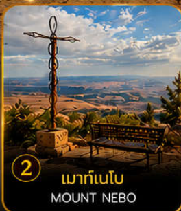
2 เมาก์เนโบ MOUNT NEBO