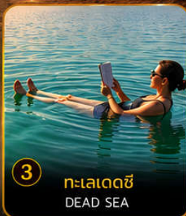
3 ทะเลเดดซี DEAD SEA