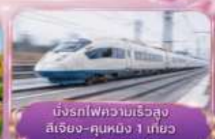
นั่งรถไฟความเร็วสูง ลี่เจียง-คุนหมิง 1 เที่ยว (รวมรถขงกระบี่)