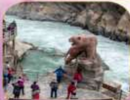
ช่องแคบเลือกระโจน