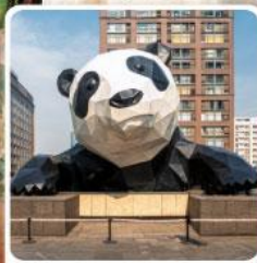
หมีแพนด้ายักษ์ป็นตึก