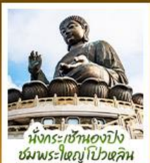
นั่งกระเช้ามองปิง ชมพระใหญ่ไผ่หลิน

นั่งกระเช้ามองปิงสักการะพระใหญ่ไผ่หลิน • วัดหวังต้าเซียน ขอพรสุขภาพ ความรัก วัดเขกงหมิว ขอพรองค์เขกง โชคลาภ การเงิน และธุรกิจ • เทพเจ้ากวนไท ความซื่อสัตย์ เงินทอง ธุรกิจมั่นคง • เจ้าแม่กวนอิมร์พิลส์บีย์ ธิบพลังงานดี เสริมพลังฮวงจุ้ยที่พิลส์บีย์