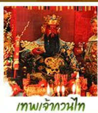
เทพเจ้ากวนไท