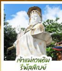
เจ้าแม่กวนอิม ร์พิลส์บีย์