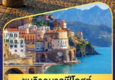
ชมวิวมอลฟีโคสก์