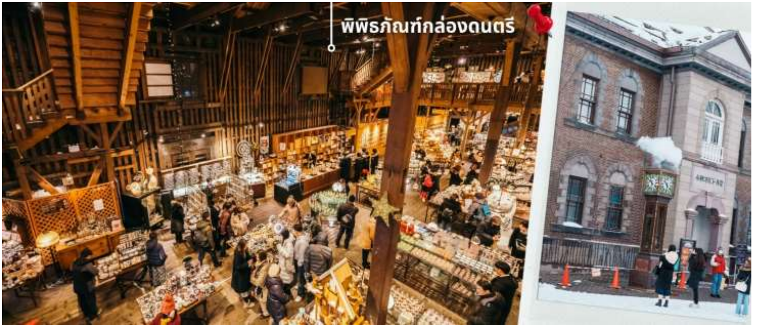
พิพิธภัณฑน์กล่องดนตรี

จากนั้นให้ท่านได้ชม หอนาฬิกาไอน้ำ ซึ่งตั้งอยู่ด้านหน้าพิพิธภัณฑน์ เป็นหอนาฬิกาขนาดใหญ่ที่รัฐบาลแคนาดามอบให้เป็นของขวัญแก่ประเทศญี่ปุ่น หอนาฬิกาแห่งนี้ ถูกตั้งเวลาให้ส่งเสียงออกมาทุกๆ15นาที และพ่นไอน้ำออกมาทุกๆชั่วโมง เหมือนเป็นจุดเช็คอินอีก1จุดของเมืองแห่งนี้ที่พลาดไม่ได้ จากนั้นให้ท่านได้ชม พิพิธภัณฑน์กล่องดนตรี ด้านในของพิพิธภัณฑน์มีพื้นที่กว้าง เป็นพิพิธภัณฑน์ที่มีเสน่ห์และเอกลักษณ์มากที่สุดอีกแห่งหนึ่งในญี่ปุ่น โดยพิพิธภัณฑน์แห่งนี้ตั้งอยู่ภายในอาคารอิฐเก่าแก่สูง 3 ชั้น ที่เดิมเคยเป็นโกดังเก่าแต่ถูกปรับปรุงจนกลายมาเป็นพิพิธภัณฑน์ ภายในเป็นสถานที่เก็บคอลเลคชั่นกล่องดนตรีที่ใหญ่ที่สุดแห่งหนึ่งของโลก ที่มีทั้งงานโบราณและงานร่วมสมัยใหม่ของยุโรป ญี่ปุ่น เก็บสะสมอยู่มากมาย มีทั้งขนาดเล็กและขนาดใหญ่นอกจากนี้ด้านในยังมีช่วงที่ เปิดโอกาสให้ผู้เยี่ยมชมสามารถทำกล่องดนตรีของตัวเองได้ ทั้งเลือกรูปแบบและการเลือกเมโลดี้เพลง เพื่อสร้างผลงานของตัวเองที่มีชิ้นเดียวในโลก และยังมีร้านค้าสำหรับขายกล่องดนตรีเพื่อซื้อเป็นของฝาก ของที่ระลึกได้อีกด้วย