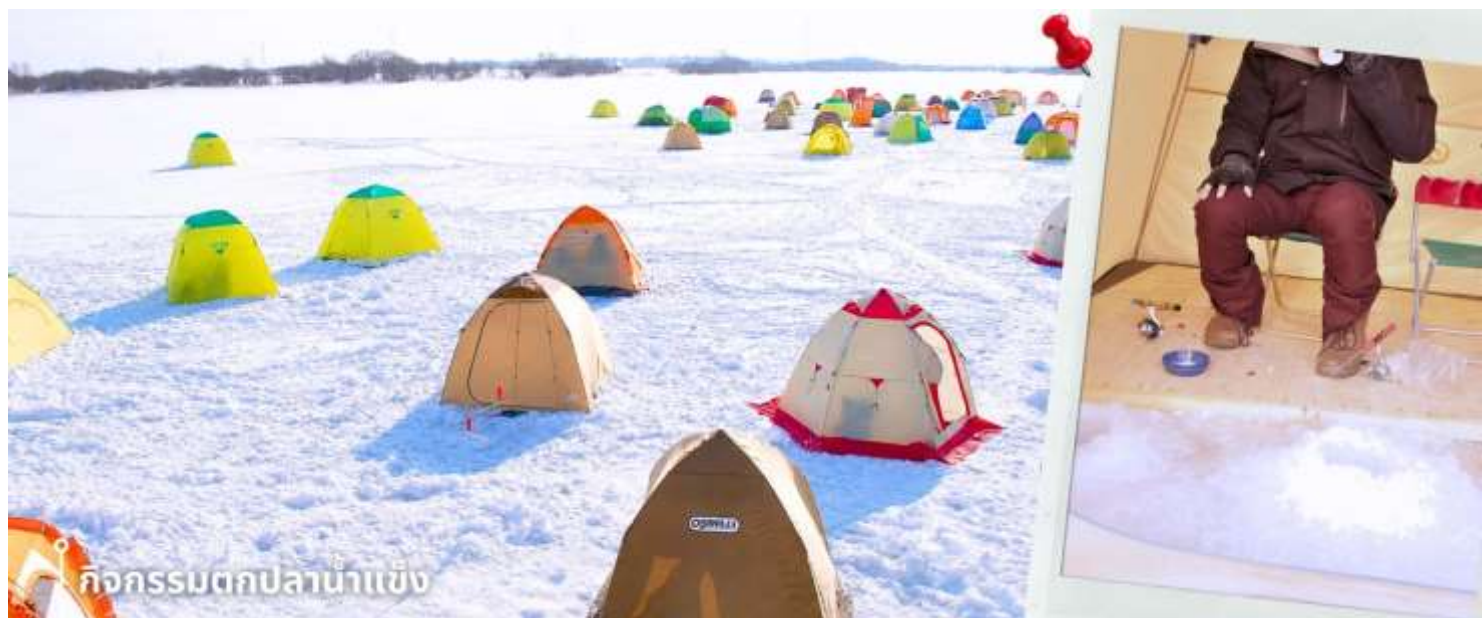
กิจกรรมตกปลาน้ำแข็ง

หลังรับประทานอาหารเที่ยง พาท่านทำกิจกรรมสุดฮิต กับ กิจกรรมตกปลาน้ำแข็ง (รวมค่าอุปกรณ์ตกปลา) กิจกรรมฤดูหนาวยอดนิยมของญี่ปุ่น กับการตกปลาน้ำแข็งท่ามกลางบรรยากาศธรรมชาติที่ปกคลุมด้วยหิมะสีขาว โดยในช่วงฤดูหนาว ผิวน้ำของทะเลสาบจะกลายเป็นแผ่นน้ำแข็งขนาดใหญ่ เปิดโอกาสให้นักท่องเที่ยวได้สัมผัสประสบการณ์ตกปลาในอากาศหนาวแบบดั้งเดิมของญี่ปุ่น ท่ามกลางบรรยากาศหิมะสีขาวและอากาศหนาวเย็นแบบญี่ปุ่นแท้ ๆ ท่านจะได้ลองตกปลาด้วยตัวเองบนผืนน้ำแข็งขนาดใหญ่ พร้อมดื่มด่ำกับวิวธรรมชาติอันเงียบสงบ