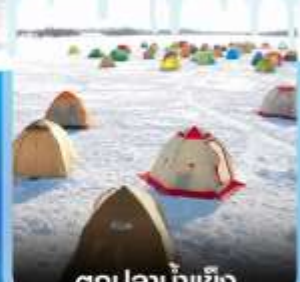
ตกปลาน้ำแข็ง