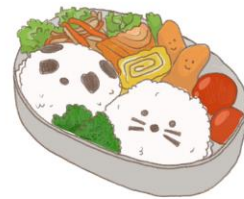
● อาหารสำหรับเด็ก ( 2-11 ปี ) * วัตถุประสงค์ขึ้นอยู่กับทาว์ราน