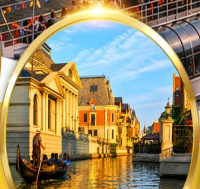
Venice Water City