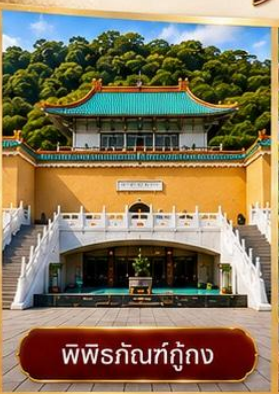
พิพิธภัณฑท์กู๋กง