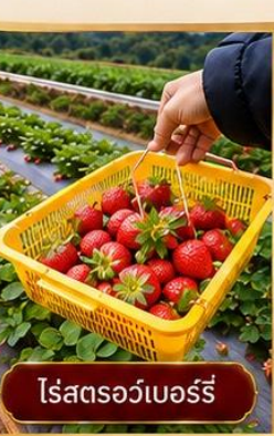
ไร่สตอร์วเบอร์รี่