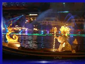
ชมโชว์เวนิสจำลอง แกรนด์วิลด์