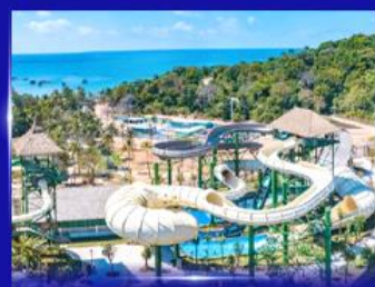
สวนสนุก Sun world Hon thom