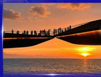
สะพานจูบ Sunset Town