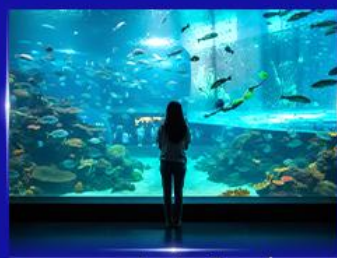
อควาเรียมยักษ์รูปเต่า