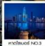
หาดโซเบอร์ NO.3

ของที่ระลึก สุดพิเศษ!! ขวดเบียร์สกรีนรูปของท่าน รัับฟรี!! ท่านละ 1 ขวด