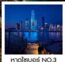
หาดไซเบอร์ NO.3

ทัวร์คุณธรรม ไม่ลงร้านช้อปปิ้ง ไม่ขายออฟชั่น