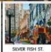
SILVER FISH ST.