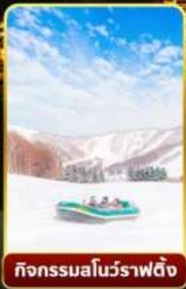
กิจกรรมโนว์ราฟติง