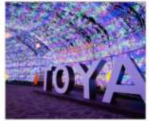
อุโมงค์ไฟโทยะ