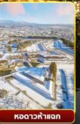
หอดาวห้าแฉก

ออนเซ็น 3 คั้น มน.กระเป๋า 1 ใบ 23 กก 7Days 5Night