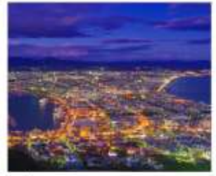
นังกระเช้าฮาโกดาเตะ