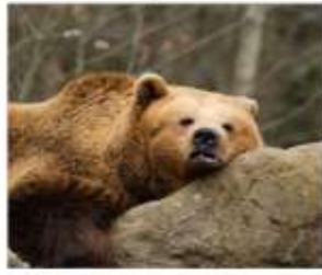
นังกระเช้าชมฟาร์มหมี