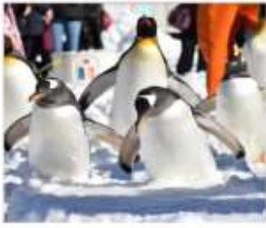
นิกเซ่มารีนพาร์ค(แพนกวิน)