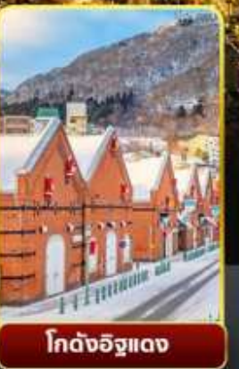
โกดังอิฐแดง