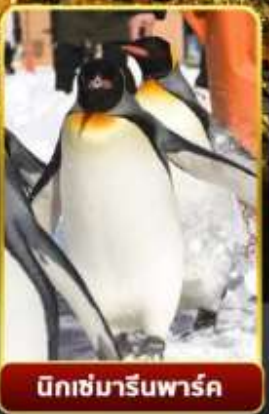
มิทซ์มารีนพาร์ค