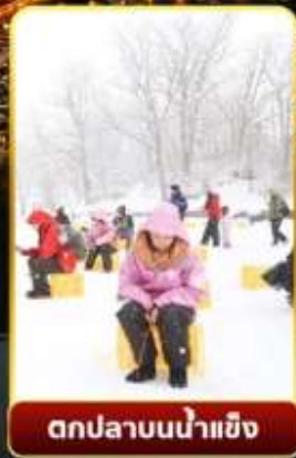
ตกปลาน้ำแข็ง