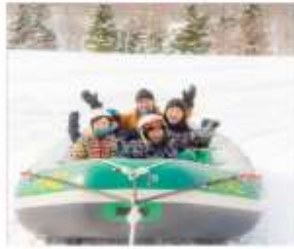
นังสโนว์ราฟตึง