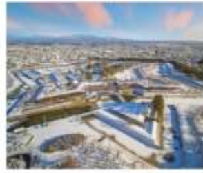
หอดาวห้าแฉกโกเรียวตะตุ