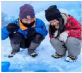
ตกปลาน้ำแข็งวากาซากิ