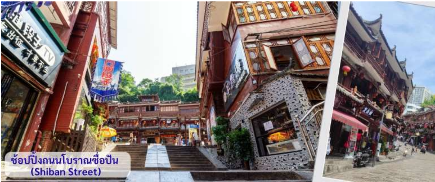
ช้อปปิ้งถนนโบราณชื้อปิ่น (Shibian Street)

จากนั้นนำทุกท่าน เดินถนนโบราณ Feng Hueng Ancient Town ที่ถนนชื้อปิ่น Shibian Street เมืองที่ยังคงรักษาเอกลักษณ์ความเป็นพื้นเมืองผสมผสานกับยุคปัจจุบันเอาไว้ได้อย่างลงตัววิถีชีวิตของชาวบ้านที่อาศัยอยู่ที่นี้ บรรยากาศในเมืองเฟิงหวง ถนนเก่าชื้อปิ่นเป็นถนนปูหินแคบๆ กว้างไม่ถึง 5 เมตร ทอดยาวจากทางเข้าวัดเต้าเหมินไปทางทิศตะวันตก ผ่านถนนหลายสาย ได้แก่ ถนนครอส ถนนเจิ้งตะวันออก ถนนเจิ้งตะวันตก ศาลาสูยหลง หียงเซียวซง เต้าชานลา ศาลาเจี้ยกั๋ว และสุสานเงินฉงเหวิน สุดท้ายจะนำไปสู่ “น้ำพุแรกใต้ฟ้า” ถนนสายนี้มีความยาวกว่า 3,000 เมตร และเป็นย่านการค้าที่คึกคักที่สุดในเฟิงหวง