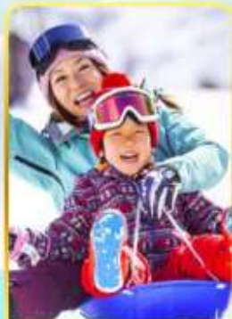
กิจกรรมลานสกีฟูจิ