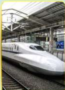
ทดลองนั่งชินคันเซน