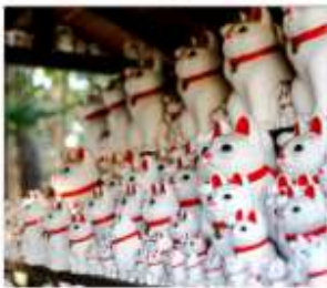
วัดโตโตคุจิ(วัดแมว)