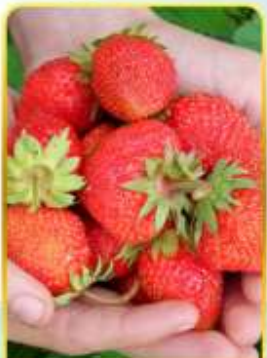
กิจกรรมเก็บสตอเบอรี่