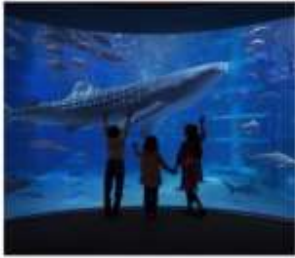
พิพิธภัณฑ์สัตว์น้ำโดยดั่ง