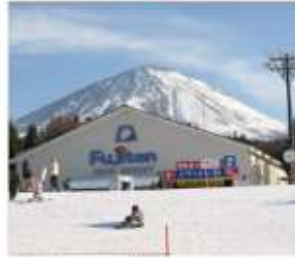
กิจกรรม ณ คานสกี