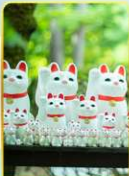
วัดโกโตคุจิ(วัดแมว)