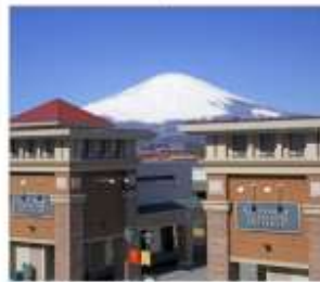
โกเท็มมะเจ้าท์เค็ต