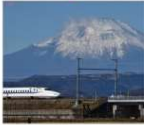
ทดลองนั่งชินคันเซน