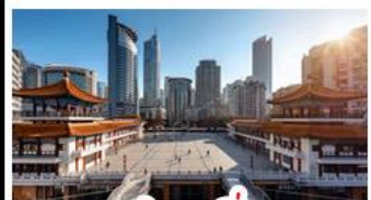
ตึกขุยซิ่ง

พระแกะสลักหินต้าจู้ - หลุมฟ้าสะพานสวรรค์ - เจานางฟ้า ตึกขุยซิ่ง - ตึกตะเกียบ - หมู่บ้านโบราณฉือซีโจว