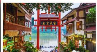
หมู่บ้านโบราณฉือซีโจว