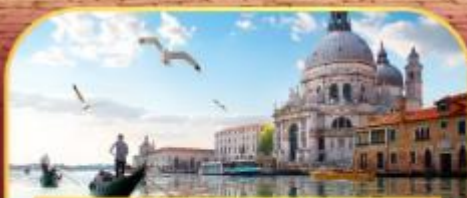
นั่งเรือสุทเกาะเวนิส