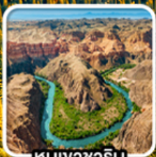
หุบเขาซาริน