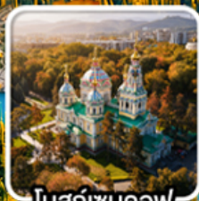
โบสถ์เซนคอฟ

นั่งกระเช้าคอนโดล่าขึ้นสู่ชิมบูลัก สตรีสอรัค ไร่มุกแห่งเทือกเขาเทียนชาน ทะเลสาบโคลโซ หุบเขาเจดี ไอกูช / ภูเขาหินเทพนิยาย / ทะเลสาบอัสซิกกุล ชมการแสดงการล่าเหยื่อของนกออินทร์