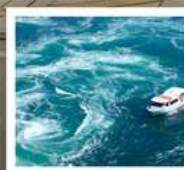
ค่องเรือชมน้ำวนมารุโตะ

วัดบึงขออน / ตลาดกิงงะ / โบสถ์โทกาวาน (จุดชมวิว) / สะพานคินไตเคียว เกาะมียาจิมา ศาลเจ้าอิตสึคุชิมะ / สวนอนุสรณ์สันติภาพฮิโรชิมา โดโกะออนเซ็น / ถนนโอโมเตะซันโด คมปีระซัง / ปราสาทมัตสึยามา กิจกรรมทำเส้นอุด้ง / สวนริทสึริน / สถานีรับทางคุรุคุรุมารุโตะ ค่องเรือชมน้ำวนมารุโตะ / ซุปป์งย่านชินโซบาช / ตลาดปลาคุโรมาง / ซุปป์งย่านอูเมะ