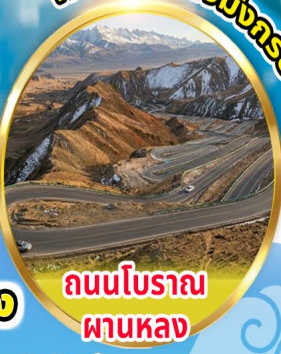
ถนนโบราณ ผานหลง