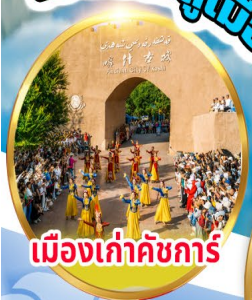
เมืองเก่าคัชการ์