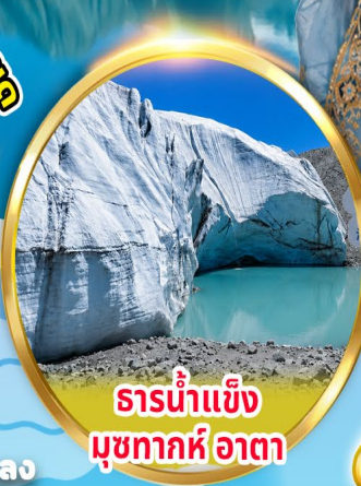
ธารน้ำแข็ง มุขทากห์อาตา