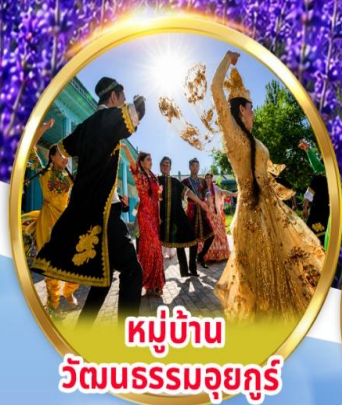
หมู่บ้าน วัฒนธรรมอูยгур

พิเศษ นั่งรถม้า + ซิมไอศกรีมอูยгур ชมการแสดง