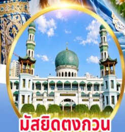
มัสยิดตงกอน