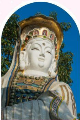
ริฟลิสเบย์ รับพลังงานดี เสริมพลังอวงจู้ย