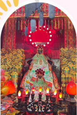
วัดเจ้าแม่กวนอิมอ่องอ่า ขอพรเรื่องเงิน ทรัพย์สิน และความมั่งคั่ง