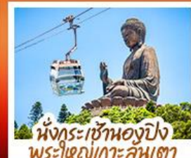
นั่งกระเช้าองปิง พระใหญ่เกาะคัมตา