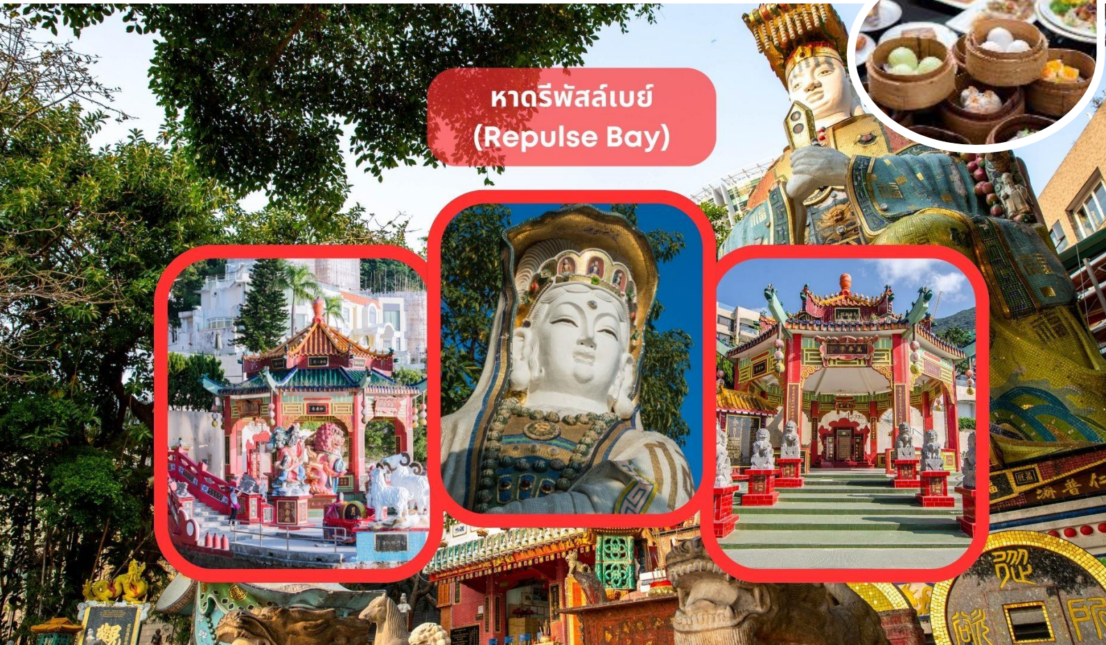
หาดรีพัลส์เบย์ (Repulse Bay)

รับประทานอาหารเช้า ณ ภัตตาคาร บริการท่านด้วยเมนูติ่มซำฮ่องกง (มื้อที่ 1)