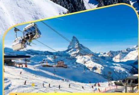
นั่งกระเช้าชมแมทเทอร์ฮอร์น