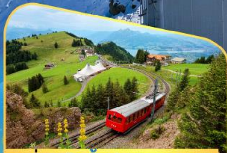
นั่งรถไฟขึ้นสู่ยอดเขาโรทิก