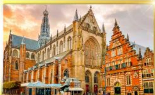
จัตุรัสเมืองฮาร์ลิม

ชมแคนเมืองแปลกเนเธอร์แลนด์และเบลเยียม เดินเมืองเคลฟท์ เมืองเครื่องปั้นดินเผาระดับโลก ฮาร์ลิมเมืองมั่งคั่งที่สุดของเนเธอร์แลนด์