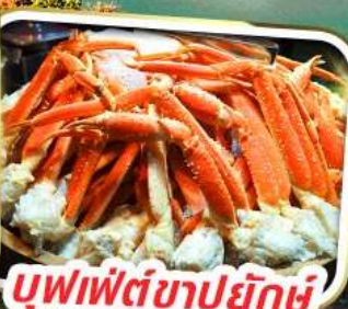
บุฟเฟ่ต์ซาปูยักษ์