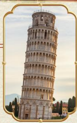
หอนอนปีซ่า