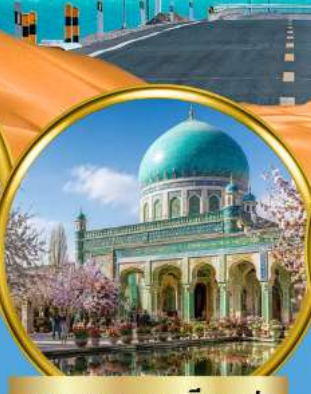
สุสานสมหอมเซียนเฟย