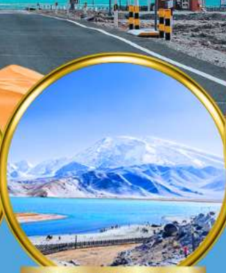
Kala Kule Lake