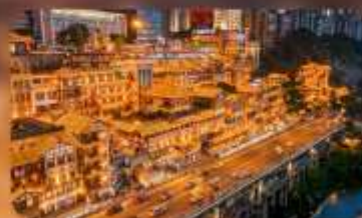
หงหย่าต้ง