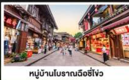
หมู่บ้านโบราณฉีซีโจว