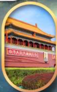
จักรีสถียนอันเหมิน