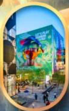
ย่านชานหลี่กุน