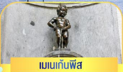
เมเนกันพีส