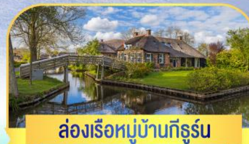
ล่องเรือหมู่บ้านทีรูรัน

HighLight • เข้าชมพิพิธภัณฑ์ลูฟท์ • 75,900 เริ่มต้น • เที่ยวบรูคส์ เมืองมรดกโลก • ชมเมืองเก่าลักเซมเบิร์ก