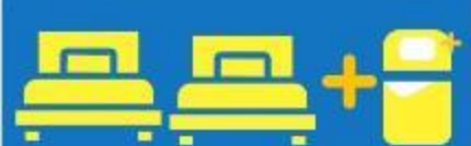
เตียง 3 ก้น ที่นอนเสริม TRIPLE