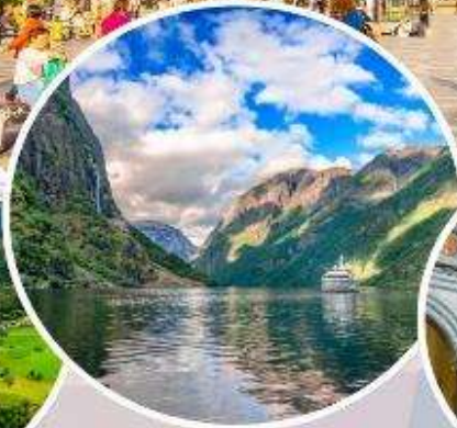
ล่องเรือ "Naeroyfjord"