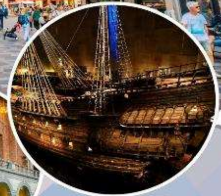
เข้าชม "พิพิธภัณฑ์เรือวาซา"