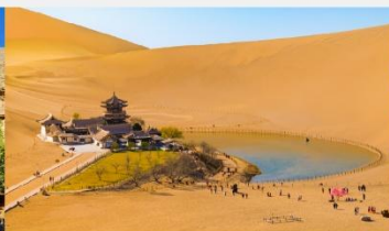
ภูเขาหมิงซาซานและทะเลสาบพระจันทร์เสี้ยว