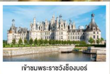
เข้าชมพระราชวังซ็องบอร์