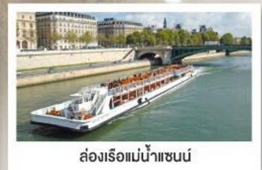
ล่องเรือแม่น้ำแชนน์