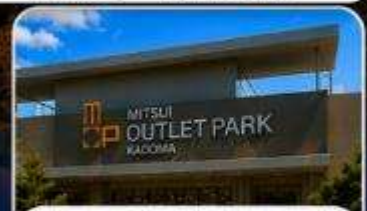
ช้อปปิ้ง MITSUI OUTLET KADOMA