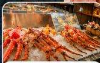
ตลาดปลาคุโรเมง