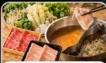
บุฟเฟ่ต์ซาบุสโตล์ญี่ปุ่น

เดินทาง : 19 - 23 ส.ค. 04 - 08 , 16 - 20 ก.ย. 69